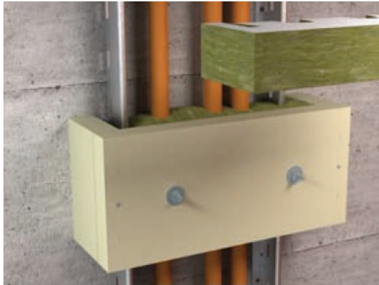
Lehké žebříky LG 60 s odlehčením tahu ZSE90